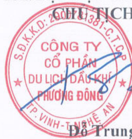
Đỗ Trung Kiên